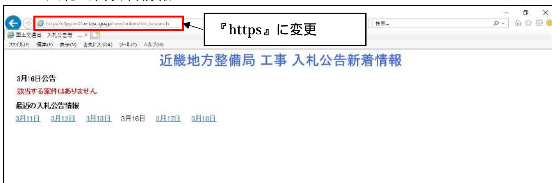
図 1-1 入札公告新着情報ページ